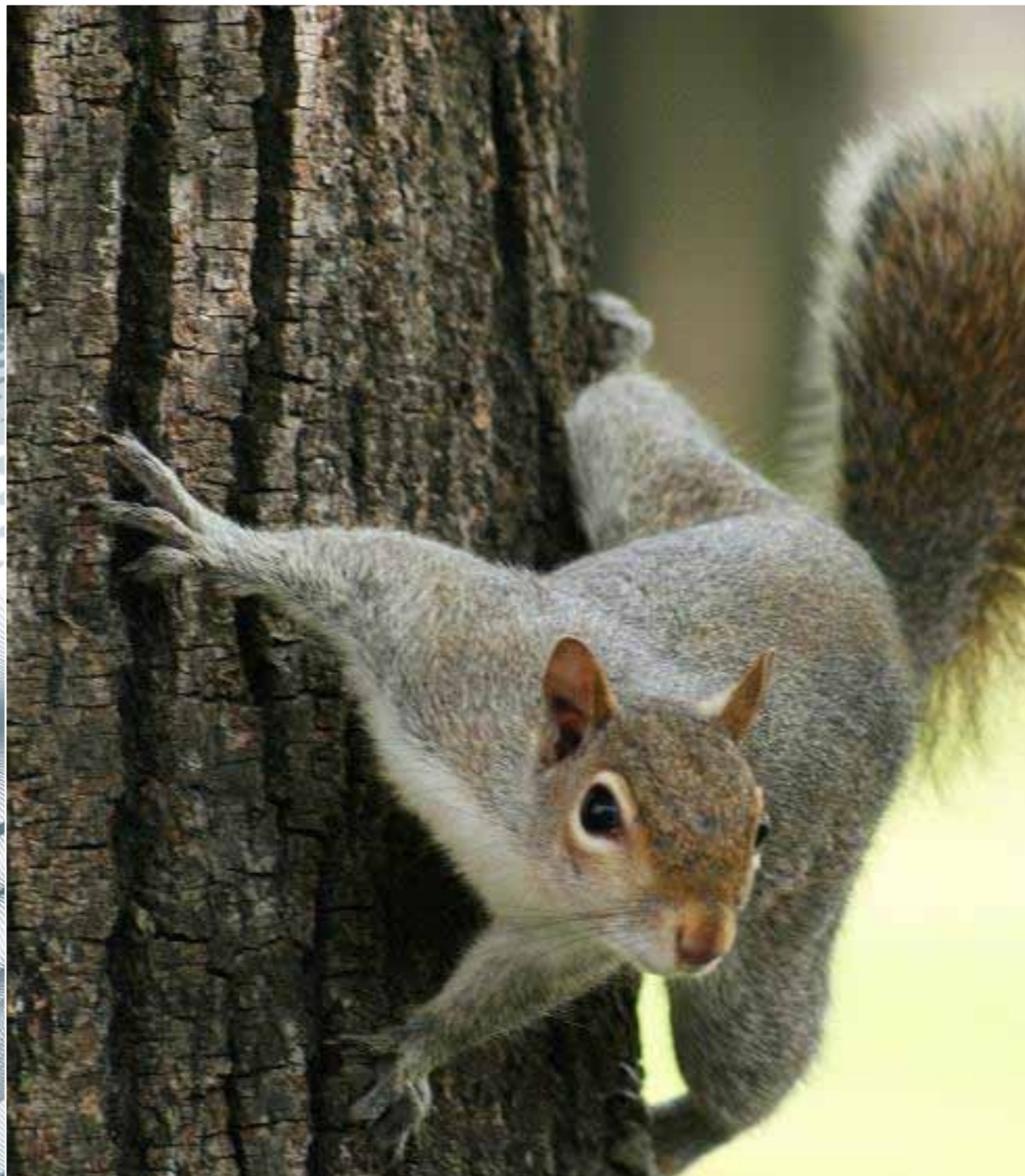
SCOIATTOLO GRIGIO AMERICANO