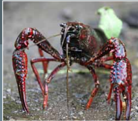
GAMBERO ROSSO DELLA LOUISIANA