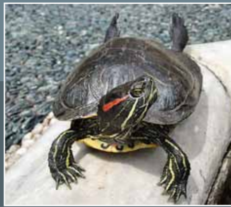
TARTARUGA DALLE ORECCHIE ROSSE