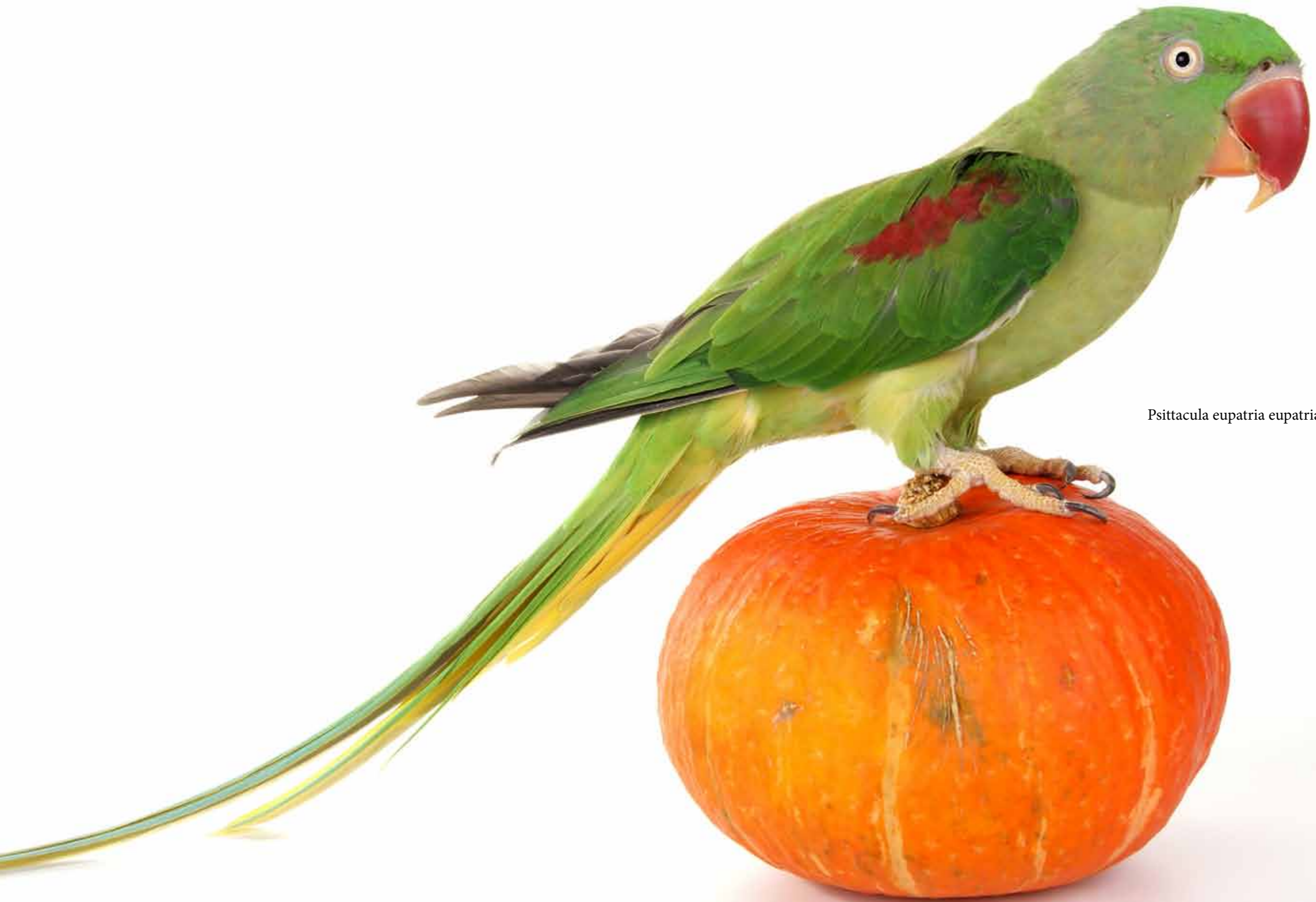
Psittacula eupatria eupatria